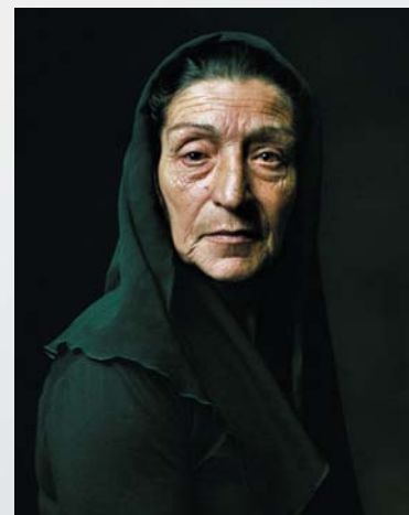
Pierre Gonnord, María , FRAC Auvergne - 2006 © Pierre Gonnord

La muestra encuentra su epílogo en el grupo de Lipchitz , Entre tierra y cielo , que evoca el poder de intercesión de la Virgen. En él el escultor añadió esta inscripción, llena de confianza en la universalidad de aquella figura maternal : « Jacob Lipchitz, judío fiel a la fe de sus antepasados, hizo aquella Virgen para la buena armonía de los hombres en la tierra con el fin de que reinara el Espíritu ».