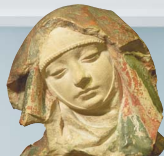
Auvernia - Cabeza de Virgen de la Piedad , a fines del siglo XV, París, Museo del Louvre