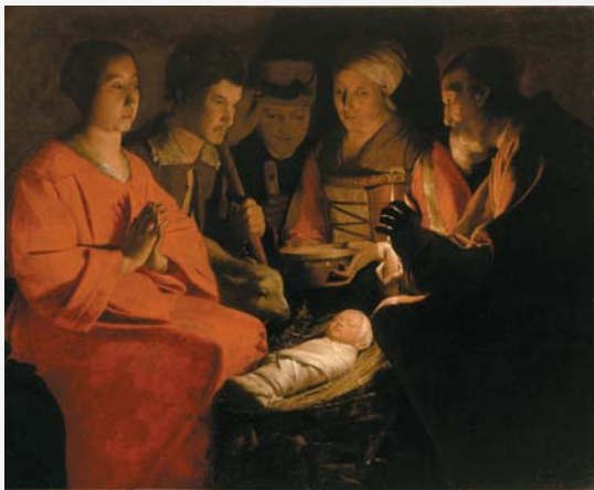
Georges de La Tour - La adoración de los pastores, París, Museo del Louvre