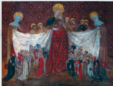
París, hacia 1410 - La Virgen del Manto