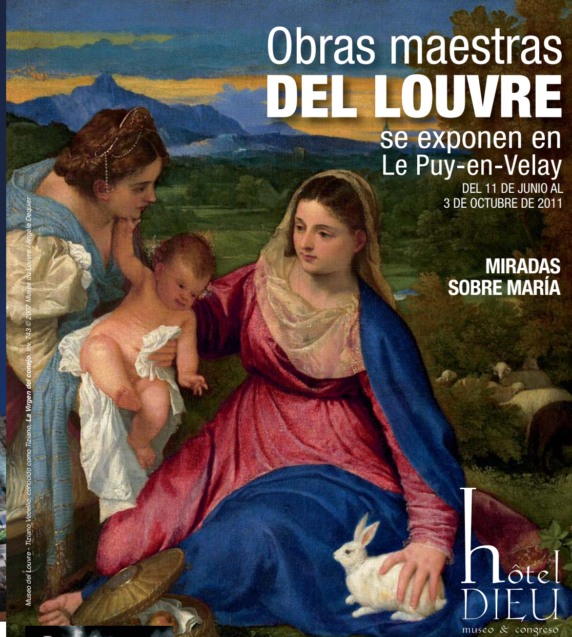
Museo del Louvre - Titiano Vecellio, conocido como Tiziano, La Virgen del campo, inv. 743