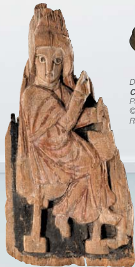
Egipto arte Copto, Virgen de la Anunciación , a fines del siglo V, París, Museo del Louvre

La primera sección invita a reflexionar sobre el frágil guión que constituye la Virgen entre las tres religiones del libro, a través obras paleocristianas, bizantinas, coptas, ortodoxas e islámicas.