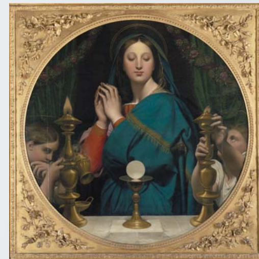
Jean Auguste Dominique Ingres - La Virgen de la hostia , 1854 París, Museo de Orsay

Una sección está dedicada al peregrinaje a la Virgen negra y al Salve Regina , la famosa antífona que la tradición dice compuesta en Le Puy-en-Velay, en torno al cuadro de Manessier prestado por el museo de bellas artes de Nantes.