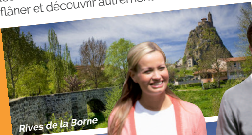
Rives de la Borne